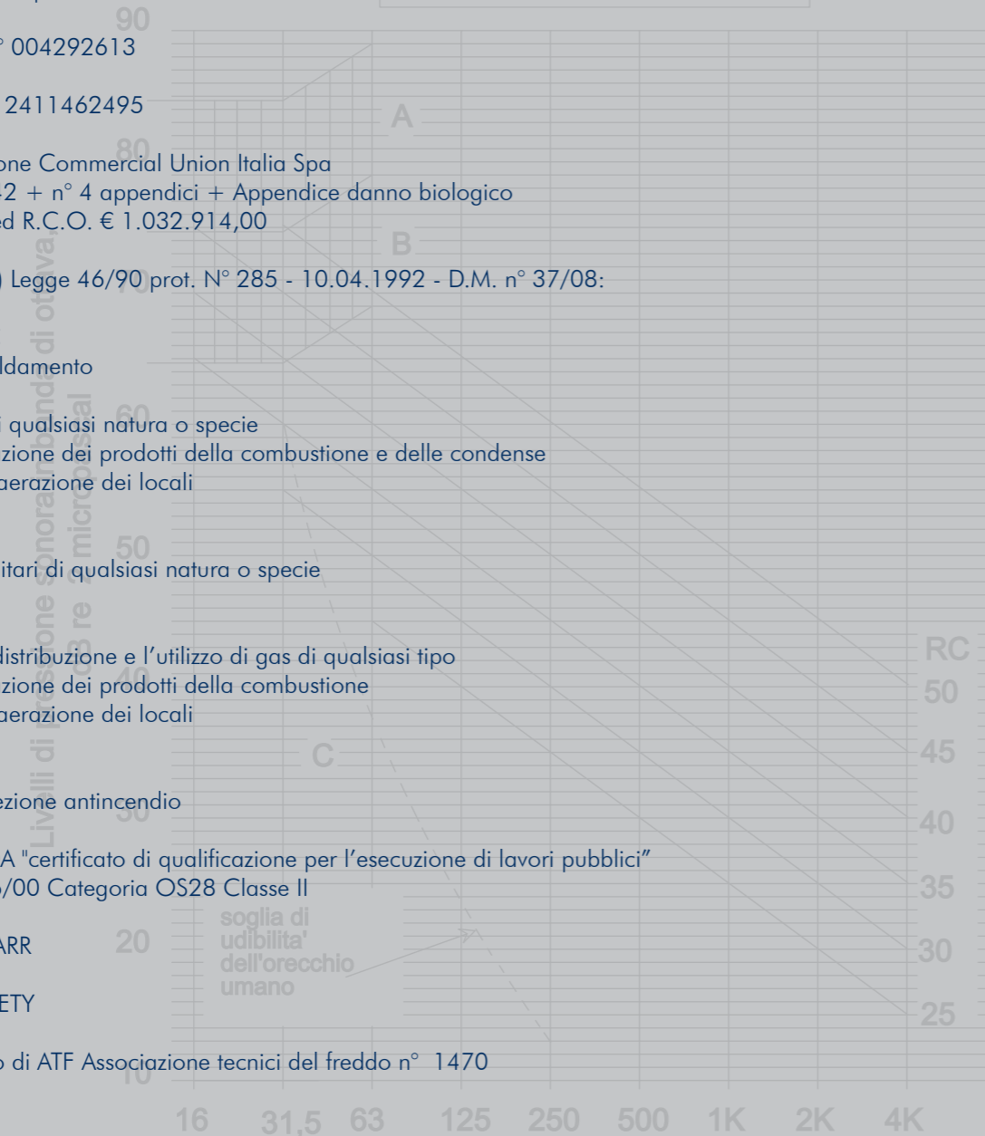
Frequenze di centro banda, Hz RC Curve di Noise Criteria

Membro collettivo di ATF Associazione tecnici del freddo n° 1470